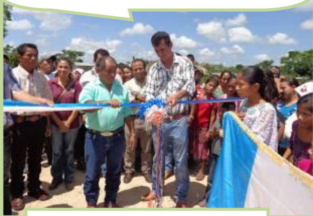
Inauguración reparación carretera

Apoyo al COCODE en la gestión de obras de beneficio social especialmente la Municipalidad de San Andrés en proyectos de reparación de carretera, construcción de puentes, construcción de aulas escolares, Puesto de Salud etc.